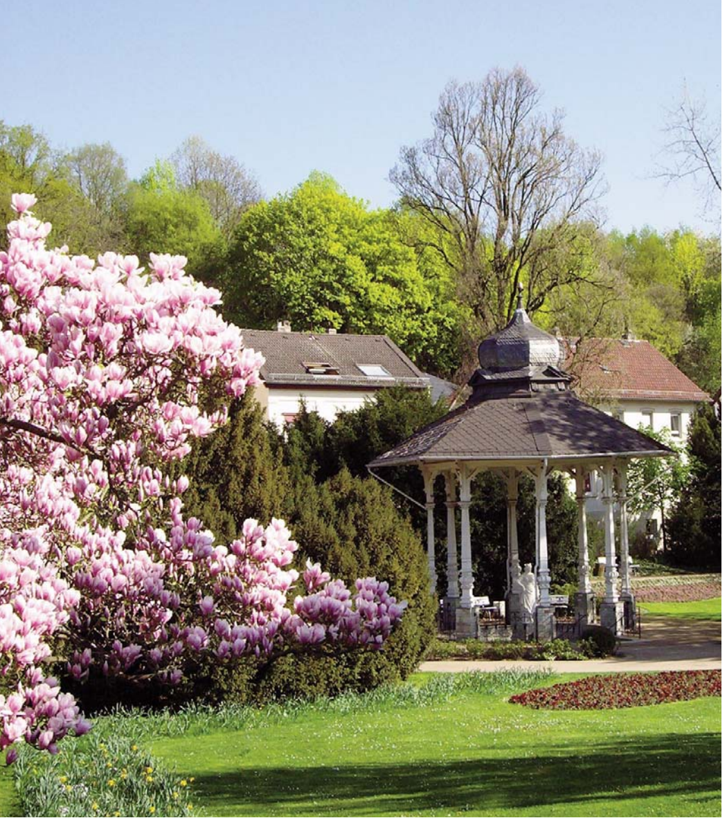
Sodenia Tempel im Quellenpark