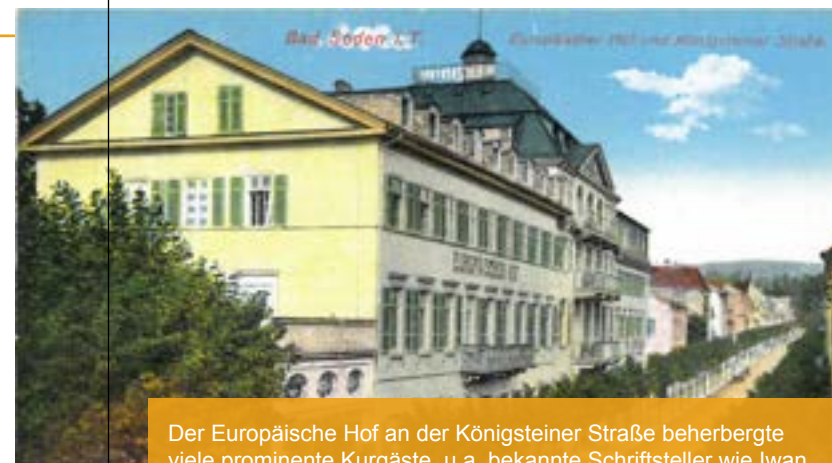
Der Europäische Hof an der Königsteiner Straße beherbergte viele prominente Kurgäste, u.a. bekannte Schriftsteller wie Iwan Turgenjew. Postkarte um 1910.

Bad Sodens erstaunliche Geschichte als Mineral- und Heilbad hat eine bemerkenswerte intellektuell-literarische Dimension. Dieses neue Führungsformat will die Teilnehmer mit großen und kleinen Protagonisten dieses literarischen Aspekts der Sodener Geschichte vertraut machen.