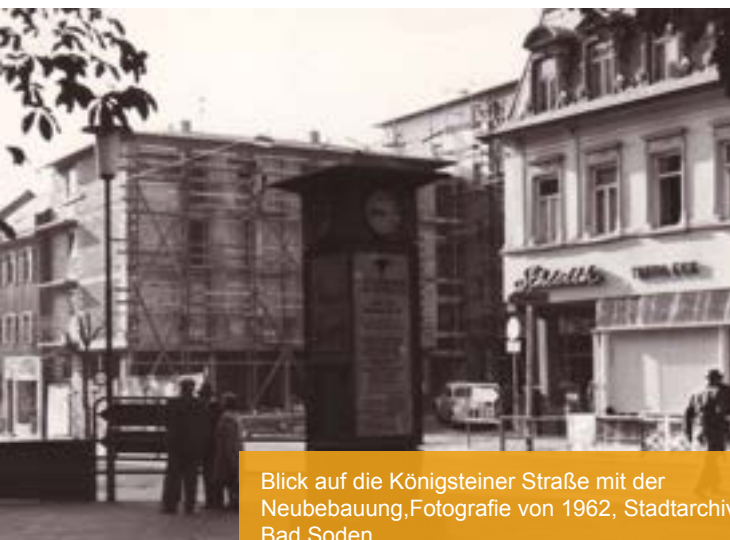
Blick auf die Königsteiner Straße mit der Neubebauung. Fotografie von 1962, Stadtarchiv Bad Soden.

Zu Beginn des 19. Jahrhunderts war Soden ein Bauerndorf, in dem sich seit etwa 100 Jahren ein sehr bescheidener Kurbetrieb entwickelt hatte. Gerade einmal 115 Familien lebten damals in der heutigen Altstadt. Mit dem Bau der Königsteiner Straße im Jahr 1820 begann für das Bauerndorf Soden eine rasante Entwicklung als Kurort. Die Heimatforscherin Heike Althenn-Mims gibt spannende Einblicke in die Historie des alten Dorfs.