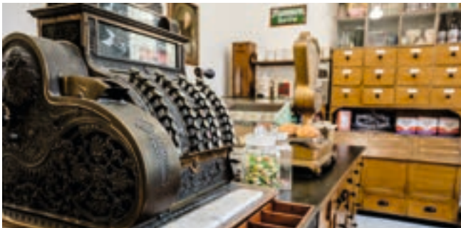
Original Kolonialwarenladen von 1910 im Stadtteilraum Neuenhain

In den Museumsräumen, die sich zum Teil noch in der Größe der einstigen Badekabinen erhalten haben, wird die über 800-jährige Geschichte des ehemaligen Reichsdorfs Soden erzählt, das 1803 nassauisch und 1866 preußisch wurde. Die salzhaltigen Heilquellen, die auch heute noch in den Parkanlagen sprudeln, haben einst die Salzgewinnung (bis 1812) und die Kur (1701-2001) ermöglicht.