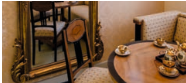
Ausschnitt des Kurzimmers aus dem 19. Jahrhundert.