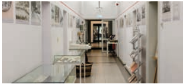
Zeitstrahl der Bad Sodener Geschichte und Schauvittrinen.

Mit der hessischen Gebietsreform 1977 kamen auch die einst eigenständigen Landgemeinden Altenhain und Neuenhain als Stadtteile zu Bad Soden am Taunus, das seit 1922 offiziell den Titel Bad im Namen trägt und seit 1947 Stadtrechte besitzt.