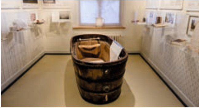
Ausschnitt aus dem Raum „Berühmte Kurgäste“ mit historischer Holzbadewanne.

... befindet sich im historischen Badehaus, das 1870/71 erbaut und 1998 zum Kulturzentrum umgebaut wurde.