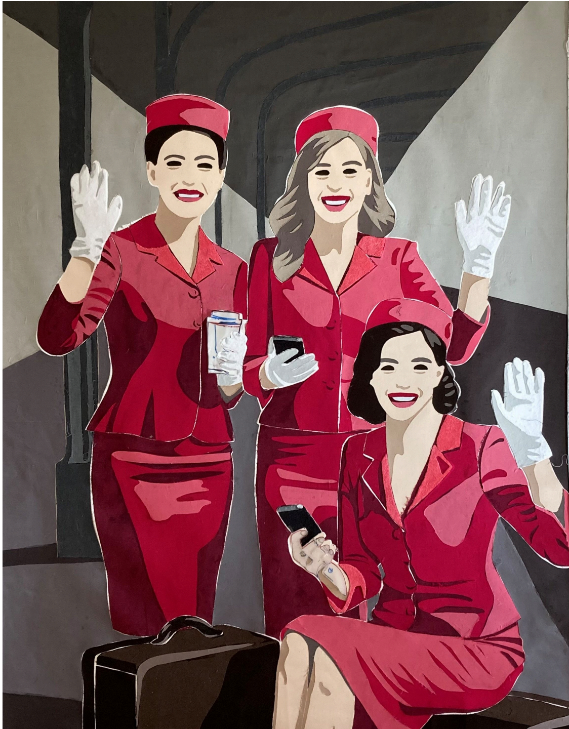
„Bye bye Love“ ist der Titel dieses Werks von Ursula Niehaus.

Das Bad Sodener Ausstellungsjahr 2026 wird mit den textilen Arbeiten der Künstlerin Ursula Niehaus unter dem Titel „Der Stoff, aus dem die Bilder sind“ eröffnet. Zu sehen sind die Werke bis Sonntag, 22. Februar 2026, in der Bad Sodener Stadtgalerie im Kulturzentrum Badehaus.