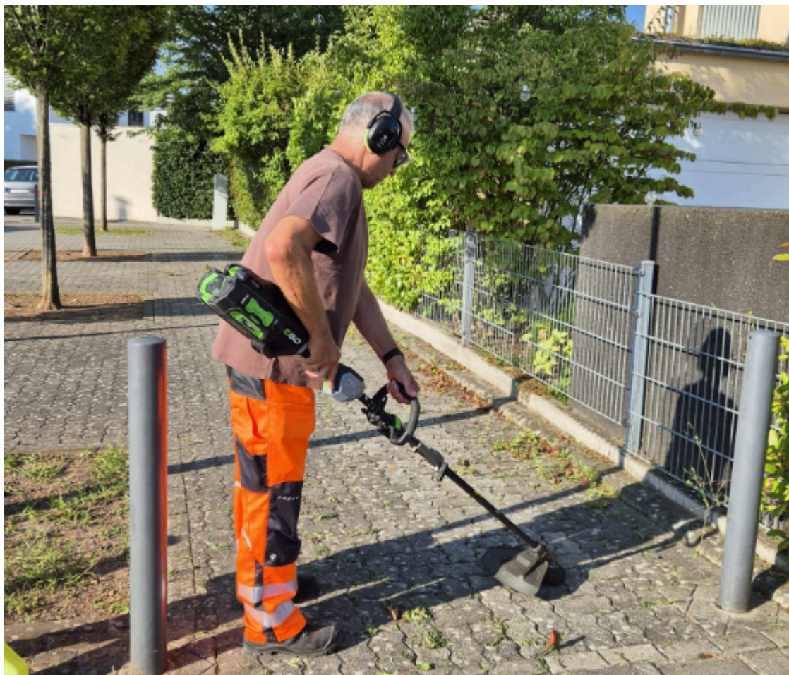
Mit der Akkuhandsense wird dem Unkraut zu Leibe gerückt.