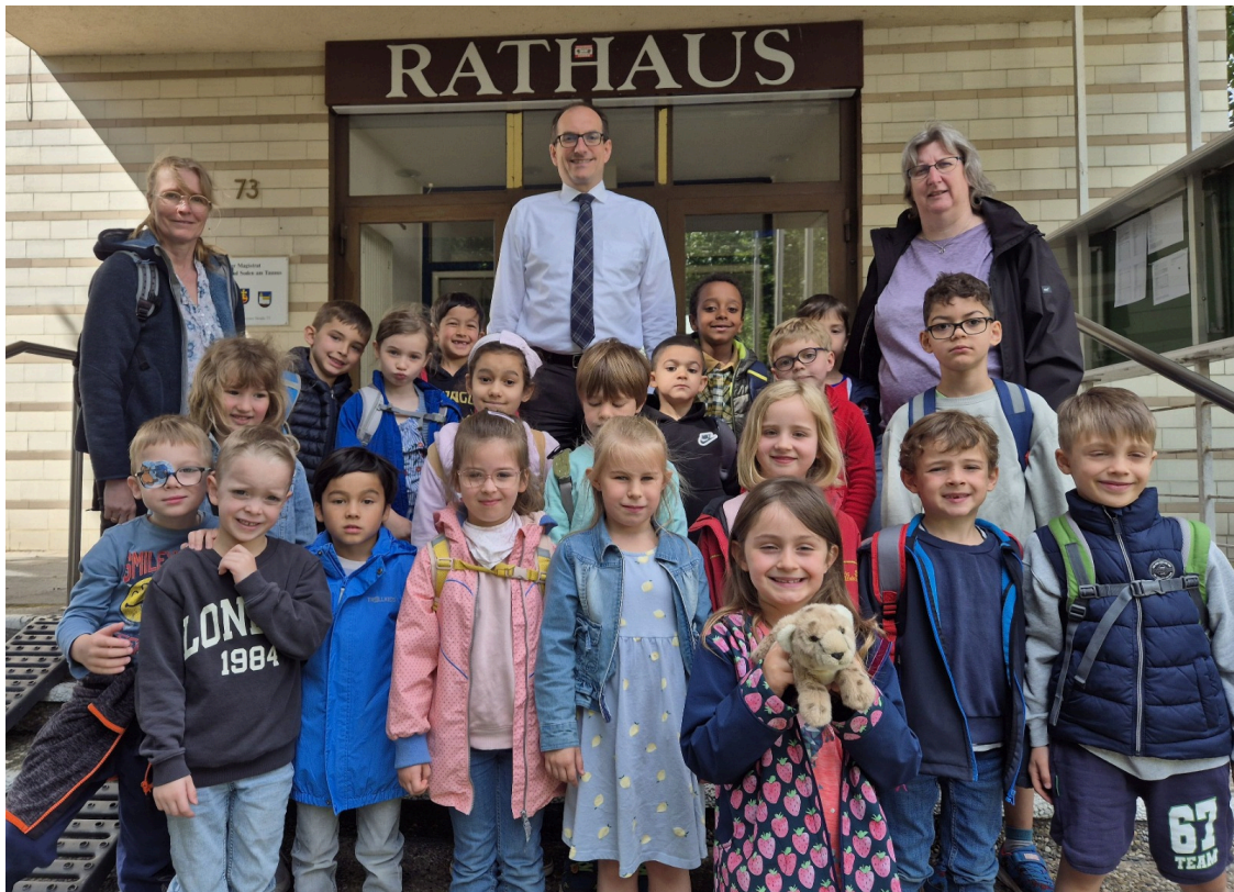
Gruppenbild mit Puma: Für die Max-Baginski-Vorschulkinder beginnt nach den Sommerferien die Schulzeit.