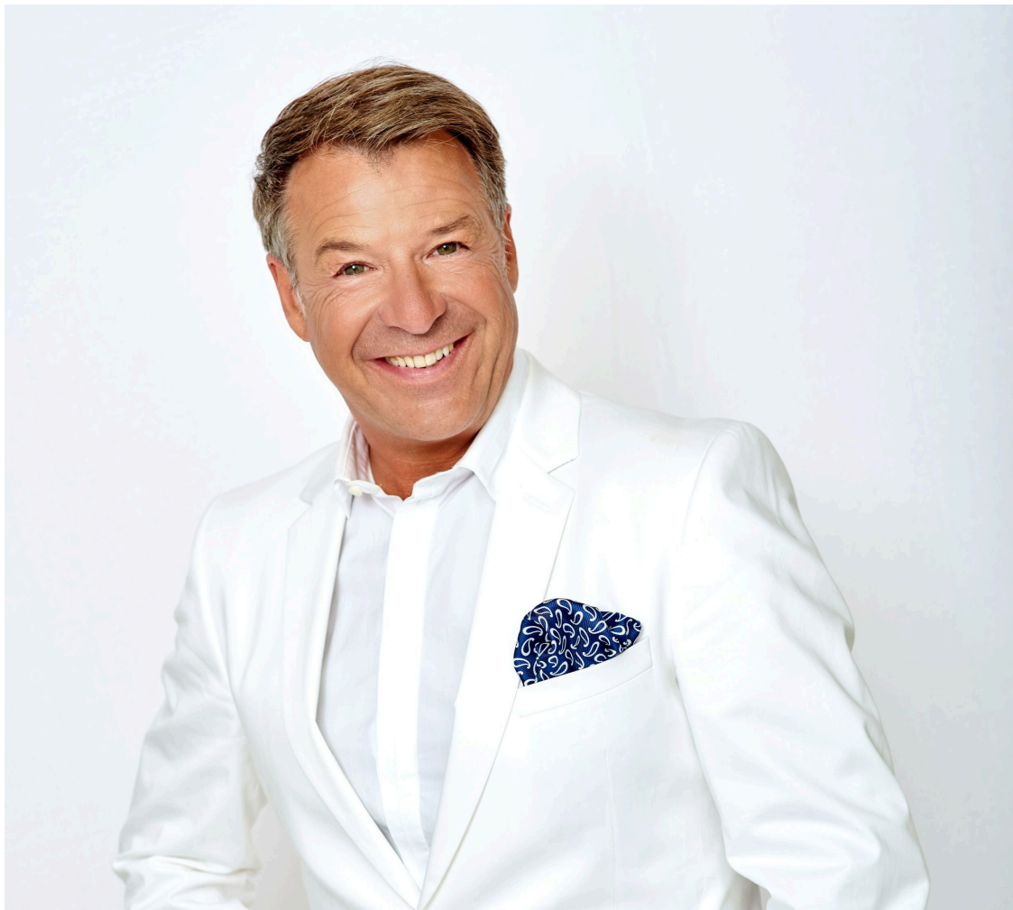
Der Schlagerstar Patrick Lindner ist am Sonntag zu Gast im Alten Kurpark.

Ein abwechslungsreiches Musikprogramm erwartet die Besucherinnen und Besucher am kommenden Wochenende in Bad Soden am Taunus. Bei freiem Eintritt laden gleich drei Veranstaltungen zum Genießen, Verweilen und Feiern ein. Höhepunkt des Wochenendes ist das Sonntagskonzert mit dem beliebten Schlagersänger Patrick Lindner im Alten Kurpark.