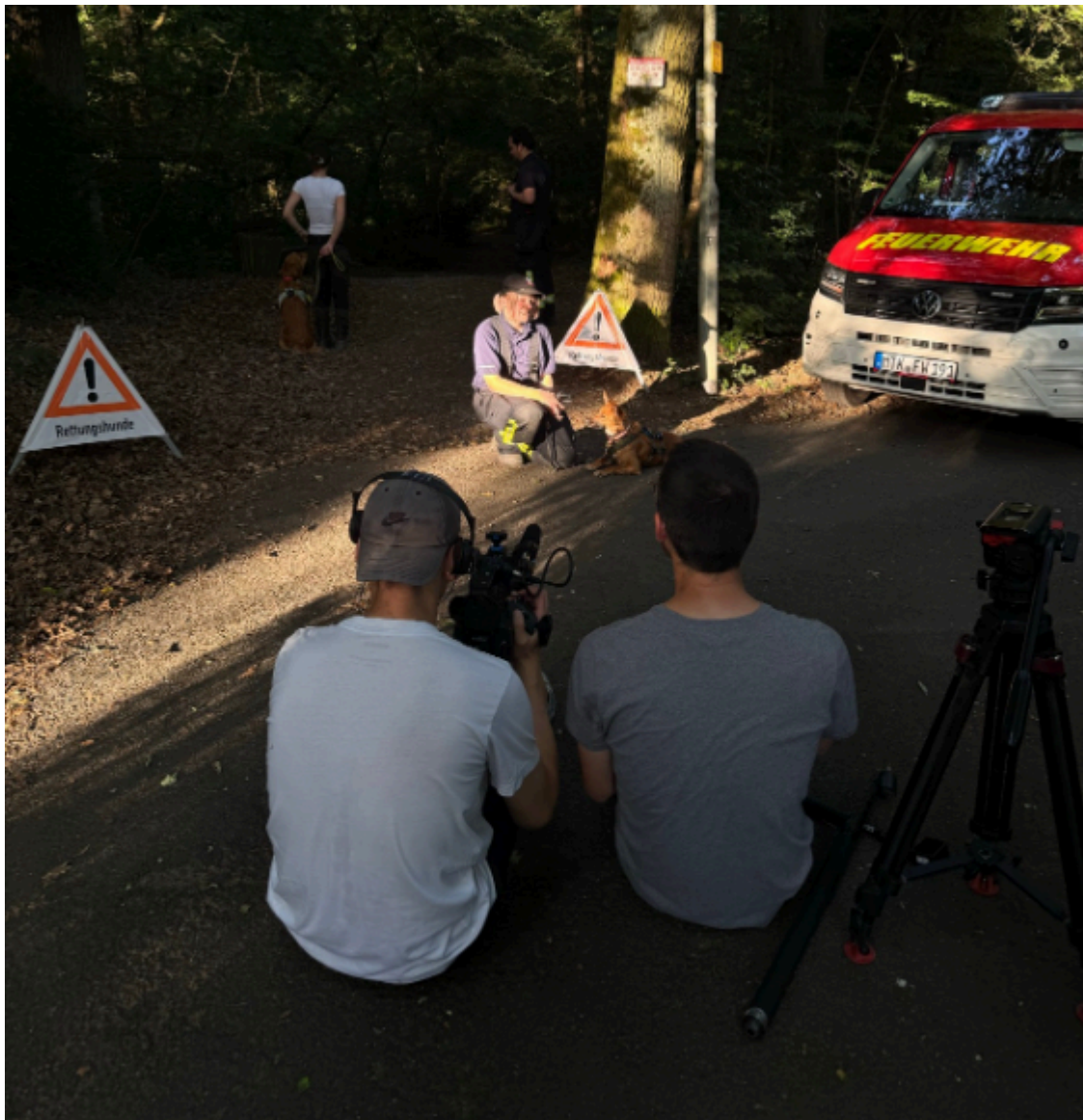
Ein Kamerateam von SAT1 begleitete das Training der Rettungshundestaffel.

Nach einem Artikel über die Bad Sodener Rettungshundestaffel in der Frankfurter Allgemeine Zeitung im Frühjahr hat auch das Fernsehen Interesse an einem Beitrag über die ehrenamtlichen Hundeführerinnen und Hundeführer angemeldet.