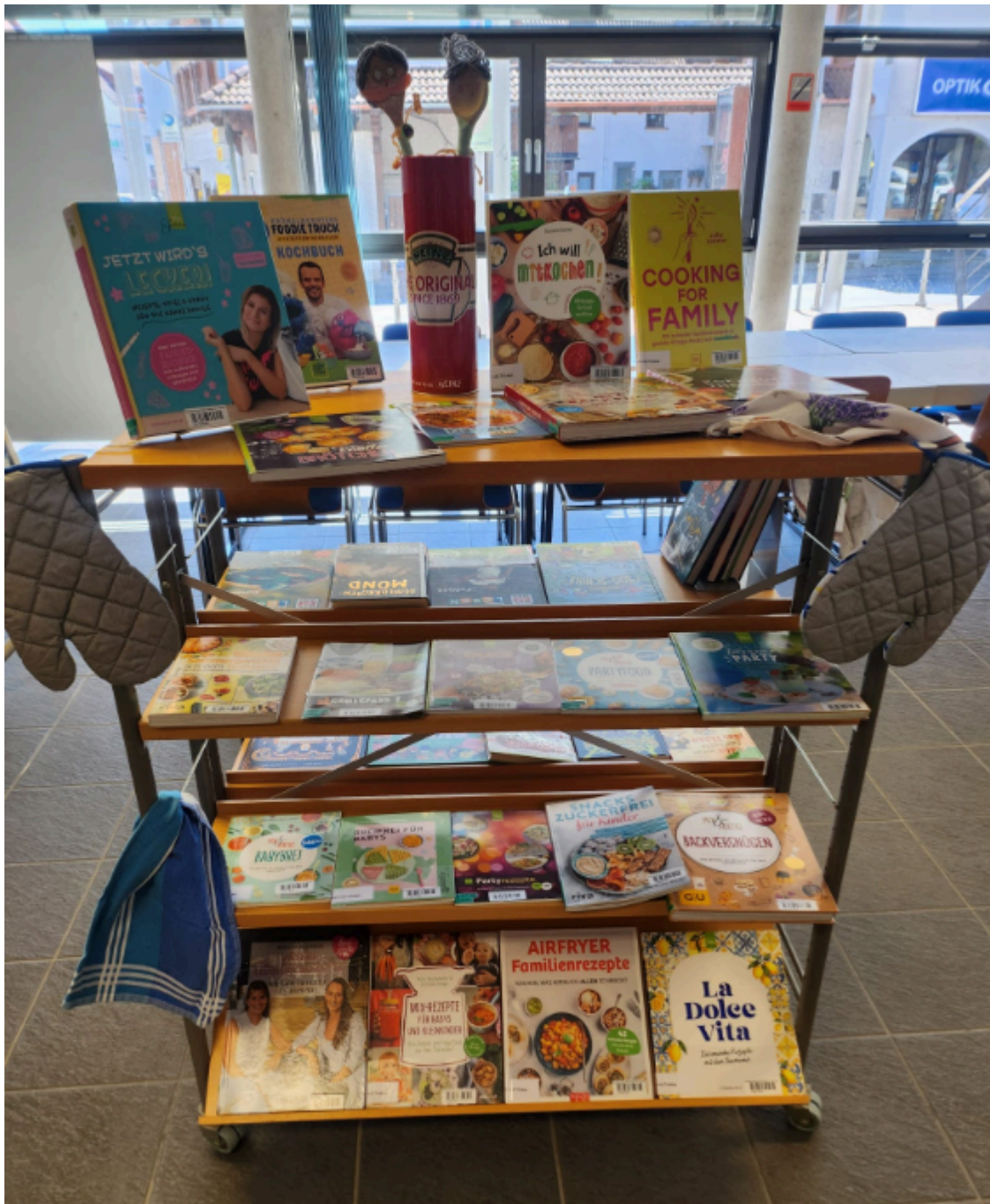
Mit bunten Thementischen wird zum Schmökern und Kochen eingeladen. Stadt Bad Soden am Taunus